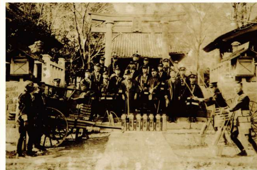
明治・大正時代のころの八坂神社（栗橋町消防団）