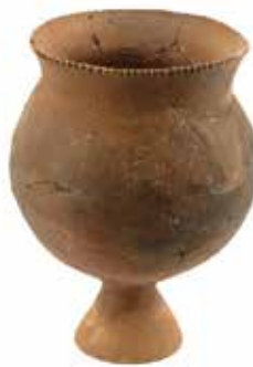
だいつきがめ 台付甕